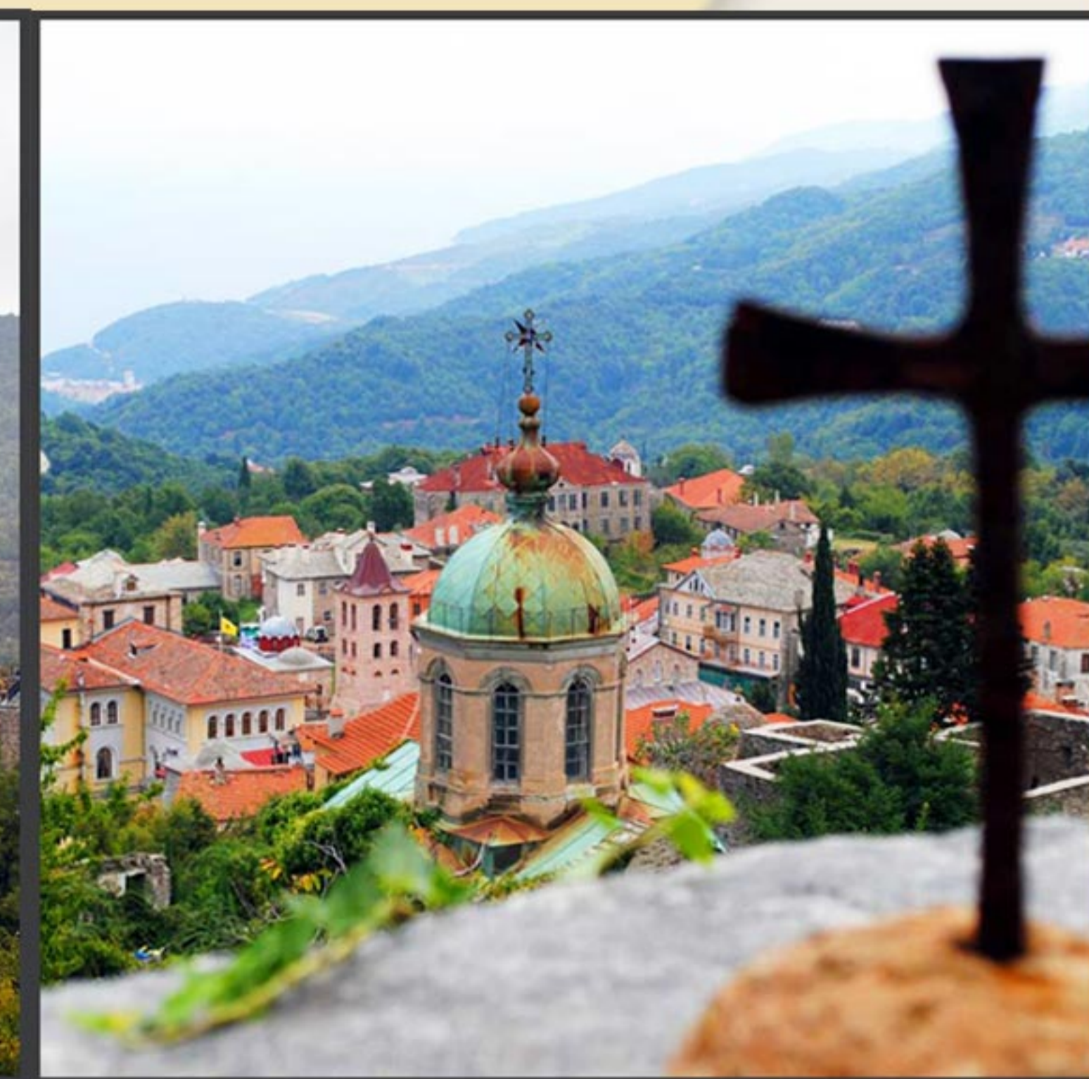
Поглед на Кареју из поснице